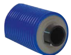
Impianti di raffreddamento (anche con cavo antigelo)