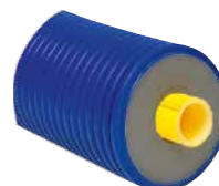
Con barriera antiossigeno per riscaldamento e raffreddamento.