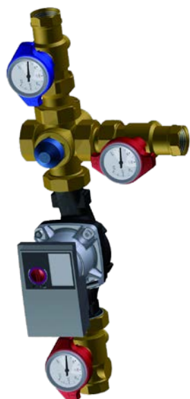
Einbaubeispiel Example of installation

To rapidly achieve the necessary operating temperature of solid-fuel fired boilers. With thermostatic mixing valve. Dynamic bypass closes reciprocally in proportion to the increasing charging temperature. Thermometer integrated into the multifunctional shut-off valve. Arrangeable gravity breaks Circulating pump 130 mm; different types and brands. Thermostatic mixing valve temperature preset at 58°C. Up to 50 KW heat output.