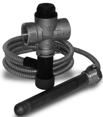
grafidea - 8FI/TS006AD